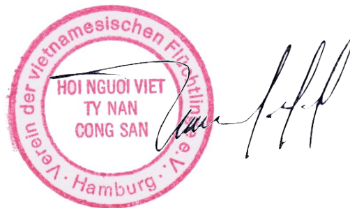
Le, Ngoc Tung Vereinsvorsitzende

Verein der vietnamesischen Flüchtlinge in Hamburg e.V. Im Namen des Vereines